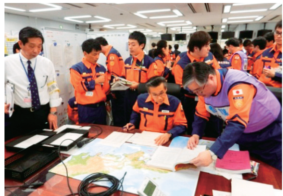
参謀班による被害状況の把握、方針の決定状況

応急対策室では、職員のさらなる災害対応能力向上と各班の業務の連携強化のために、定期的に図上訓練を実施し、災害発生時の対応に万全を期することとします。